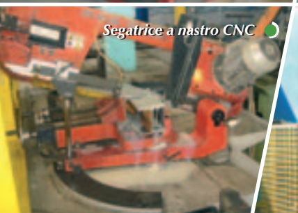
Segatrice a nastro CNC