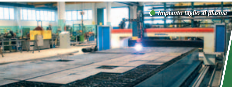
Impianto taglio al plasma